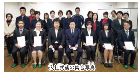
入社式後の集合写真