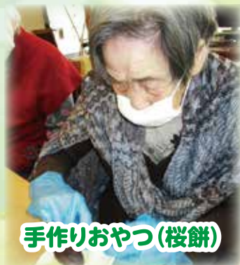
手作りおやつ(桜餅)