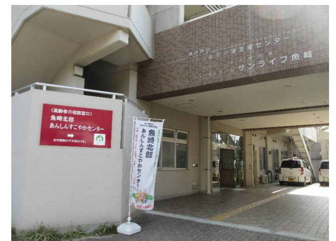
魚崎北部あんしんすこやかセンター（玄関前写真）左手建物の1階が受付です。